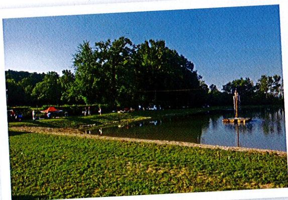
Lac Vert de Minzier

proposé aux 3000 visiteurs, de l'alimentaire, du bien être, de l'habitat écologique, des jouets, de la décoration, des vêtements, de la puériculture. La journée a été animée d'une buvette et repas, de promenades nature avec la FRAPNA, d'une visite d'exploitation agricole laitière