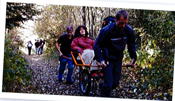
Dans le Vouan

Partenariat entériné avec Espace Handicap par la signature d'une convention pour offrir au public handicapé de l'association annemassienne, la possibilité de découvrir les richesses naturelles de la région au cours de randos nature. Un programme de sorties (une par mois) a été programmé sur une année. L'association dispose de trois joëlettes grâce à l'aide du CAF et a organisé en 2009 des sorties dans les Voirons et le Vouan. Ces sorties mobilisent l'énergie et la passion de nombreux bénévoles. Ce sont des moments intenses de partage.