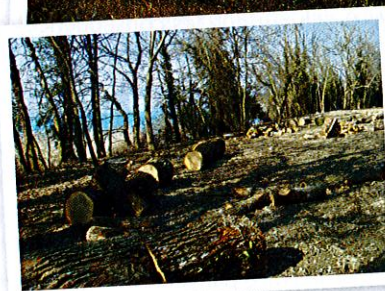
Ancienne décharge municipale de Chens