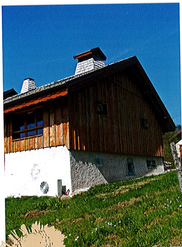
Journée du Patrimoine : ancienne ferme avec sa cheminée en bois