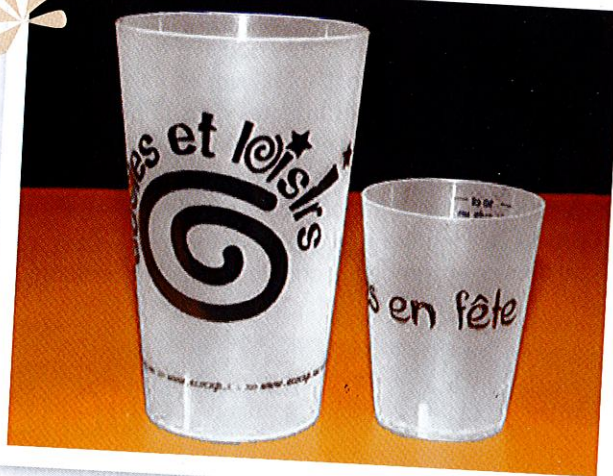
Gobelets "Ecoles et Loisirs" achetés par l'association de parents d'élèves et gobelets "Fillings en fête" achetés par la commune...

Chloro'Fill s'est engagée dans une réflexion avec des associations communales et la municipalité pour une réduction et le tri des déchets lors des grandes manifestations du village. Ainsi, en collaboration avec elles, ont été proposés une organisation et des moyens d'actions ensuite évalués sur leur fonctionnalité. Après un premier bilan, des améliorations ont été apportées propres à chacune des fêtes en vue des années suivantes. En parallèle, a été lancé un projet d'achat de gobelets lavables et consignables. L'association de parents d'élèves et la municipalité ont été parties prenantes et ont investi, l'une pour 1000 gobelets et l'autre pour 3000. Désormais, quand il y a une fête, le consommateur achète sa première boisson un euro plus cher et récupère cette somme quand il rend son verre, au moment de partir (pour plus d'info sur le principe: http://www.ecocup.fr/ ).